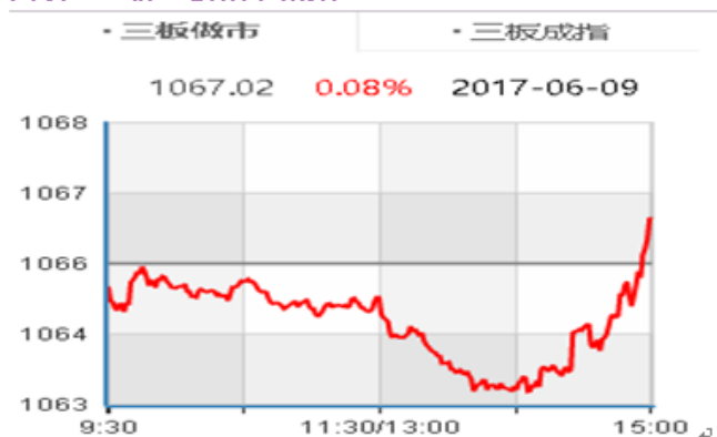
图表5： 新三板做市指数