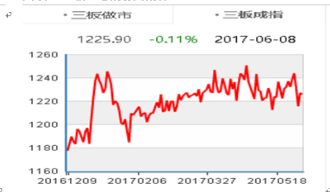
图表6： 新三板成分指数