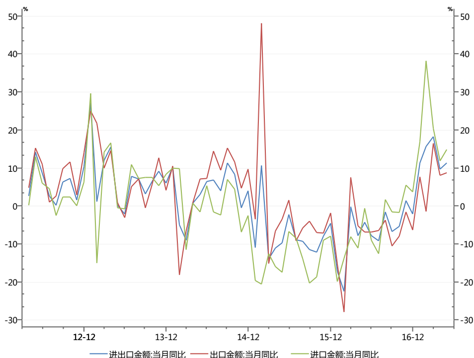
图表2: 5月进出口增速环比回升