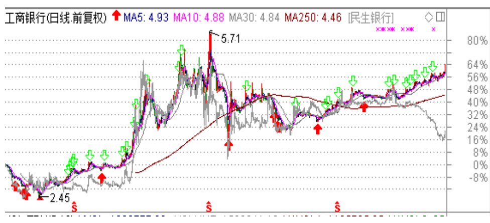
图表2： 工商银行与民生银行走势对比

从去年底开始的市场利率的大幅上行，与大多数行业受负面影响相比，保险公司和大型商业银行相对受益。当市场利率出现向上的拐点后，占保险公司收入大头的固定收益将显著提升，四大行本身资金充裕，资金的价值提升显著。从过去一段时间的比较来看，四大行的上升趋势与中小型商业银行的走势分道扬镳，形成巨大的反差，基本面的差异决定了彼此表现的不同。在金融去杠杆、防风险的过程中，经营稳健，创新方面不冒进的大型金融机构反而有收获。从近期沪港通、深港通的数据来看，北上资金总体持续维持金融股的买入，金融股有望成为阶段市场的热点。