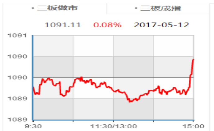
图表 3：新三板做市指数