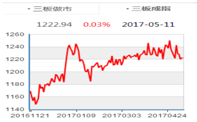
图表 4：新三板成分指数